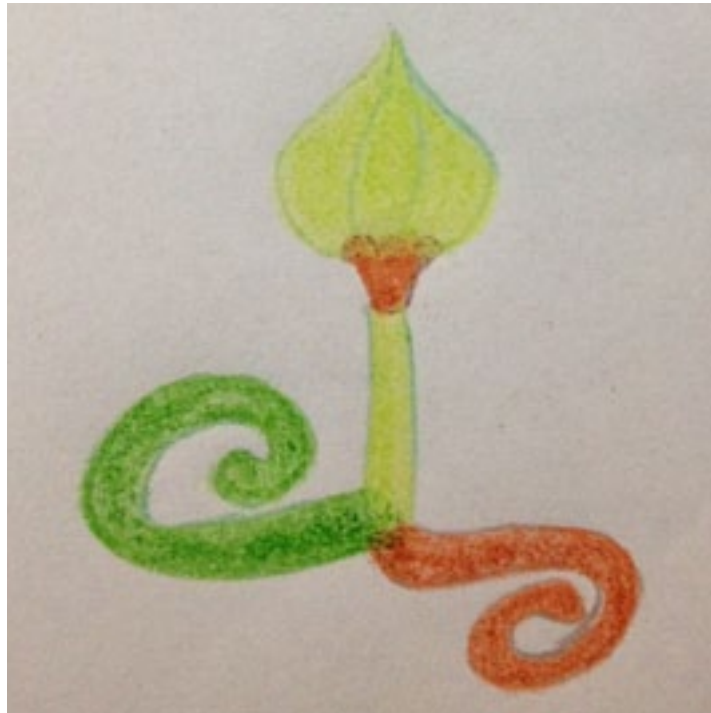
Ilustración 1: La flor del cáliz

Hace tiempo que los maestros os venimos diciendo que la búsqueda está en vosotros mismos, en vuestro interior.